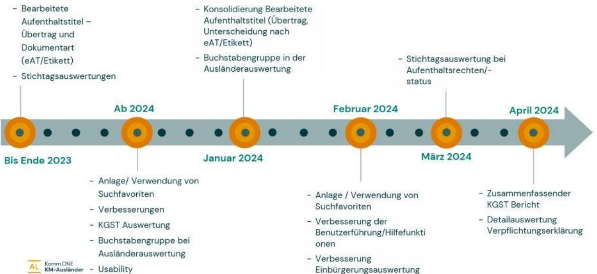
Roadmap KM-Ausländer | Planung Auswertungen 2023/2024

Die Roadmaps wurden auf unserer bekannten Landingpage aktualisiert und fortgeschrieben, sowohl für KM-Ausländer wie auch für den Bereich Auswertungen: